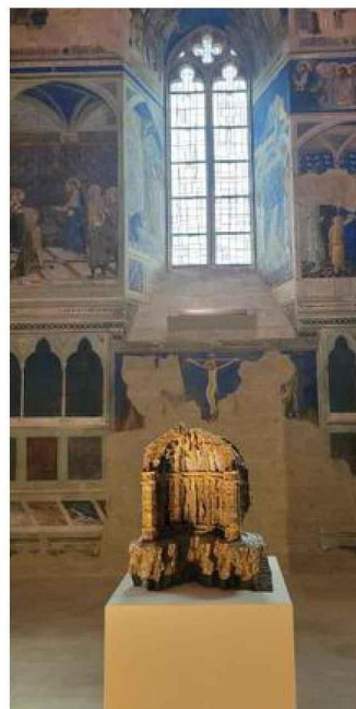
La superbe Chapelle Saint Martial accueille cette « Petite folie » dont le bronze imite parfaitement l'habituel carton de l'artiste.

Car tous ces nouveaux développements de son œuvre exigent de faire appel à des spécialistes du verre, de la broderie, du bronze (pour une superbe petite pièce dans la Chapelle Saint Martial). « Les artistes et les artisans ont toujours travaillé ensemble », rappelle-t-elle. « Puis ça s'est interrompu avec cette