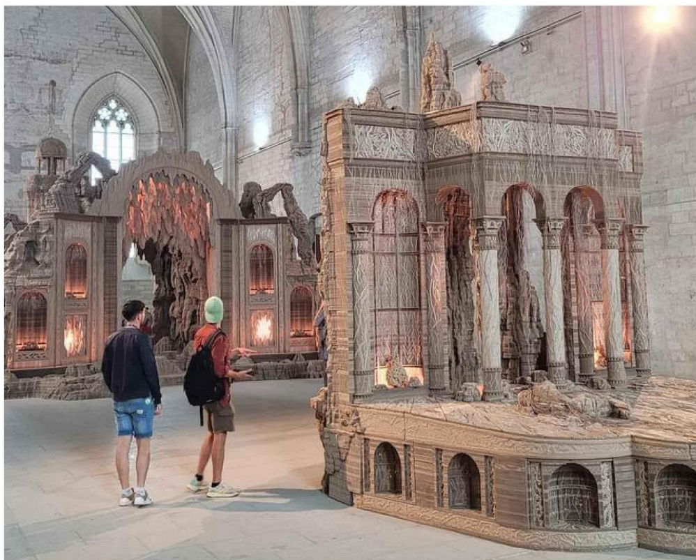
Trois sculptures monumentales en carton attendent le public dans la Grande Chapelle.

Comme ces broderies étaient très abîmées, à certains endroits, les fils laissent apparaître le dessin en dessous. Cela m'a donné l'idée de travailler sur le lien entre le dessin et le fil