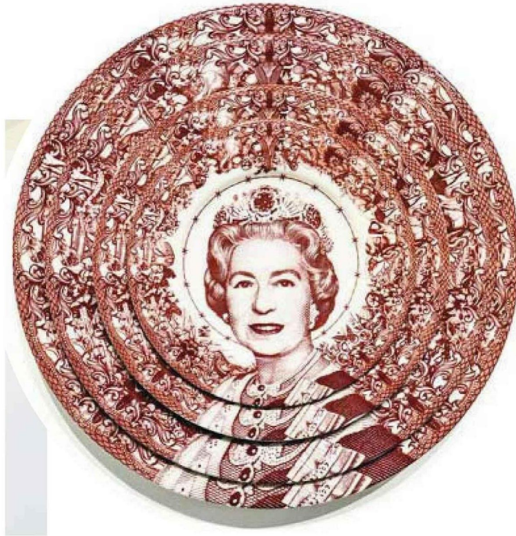
Gastric Icon III / Queen of England, 2020, de l'Espagnol Carlos Aires, sur le stand de la galerie hongroise Ani Molnár, à Art Brussels.