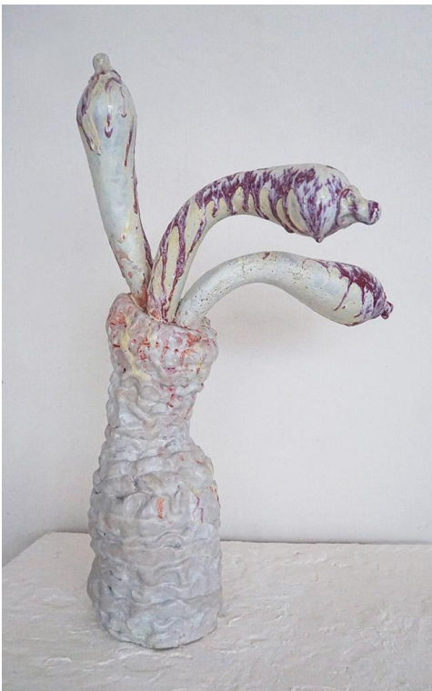
Galerie Papillon, Elsa Sahal, Vase Amazones, 2023, glazed ceramic, 66x40x25cm

Dans la section Discovery, 65 % des galeries participent pour la première fois. Au total, nous sommes ravis d'accueillir 30 % de nouvelles galeries qui n'ont pas encore participé à la foire. Grâce à cela, non seulement les projets des stands, mais aussi les galeries apportent un vent de nouveauté et de découverte aux amateurs d'art et aux collectionneurs belges et internationaux qui viennent visiter la foire.