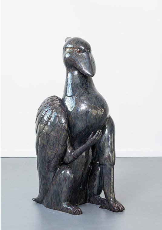
Ballon Rouge Pei-Hsuan Wang, Statue of Asking Threshold Guardian I, 2022, Stoneware, glaze, 44 x 94 x 54 cm.

L'on observe un nombre record de galeries dans la section REDISCOVERY : comment cela s'explique t-il selon vous ?