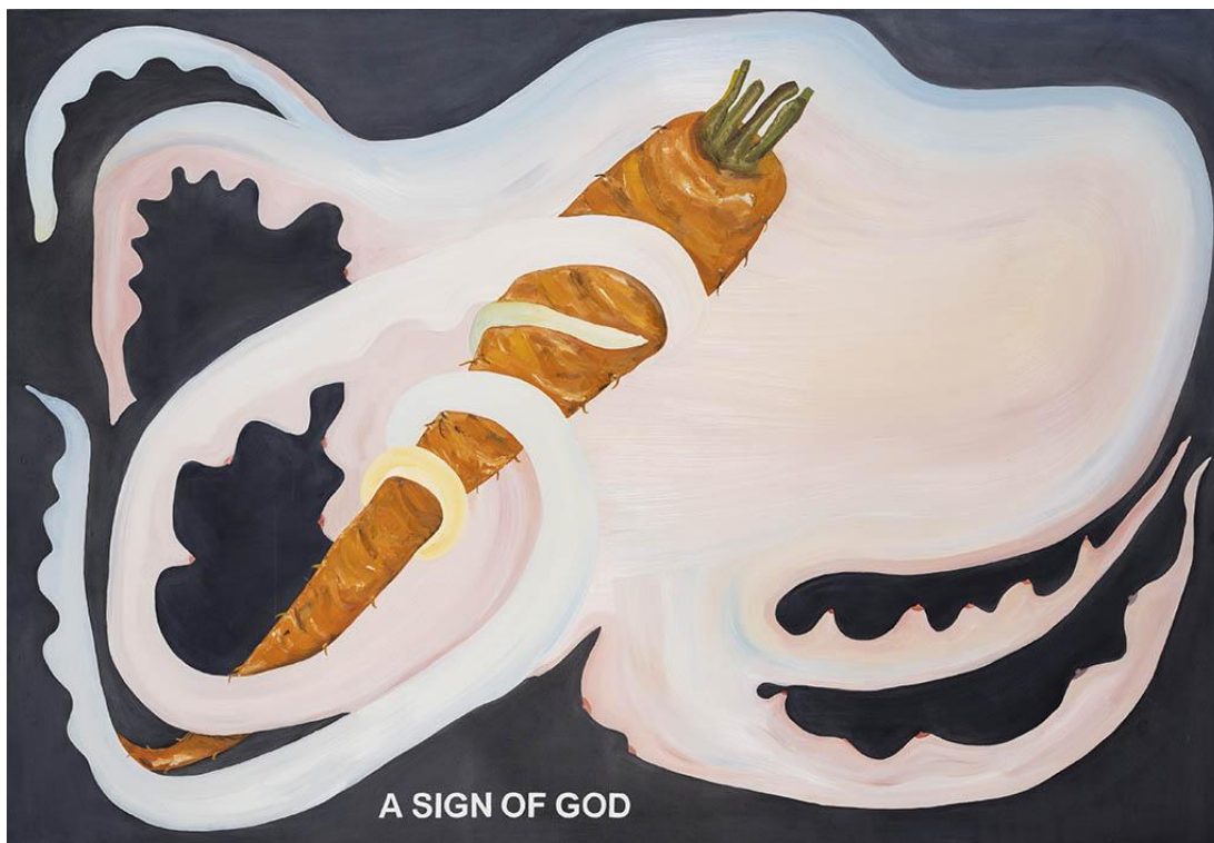
Nathalie Obadia, Laure Prouvost, The Octopus Body A sign of God, 2022, Oil on canvas, 160 x 230 cm (63 x 90 9.16 in.)

Le comité de DISCOVERY a tenu compte de la parité hommes-femmes. Le comité international a également tenu compte de la parité hommes-femmes pour les sections SOLO et REDISCOVERY.