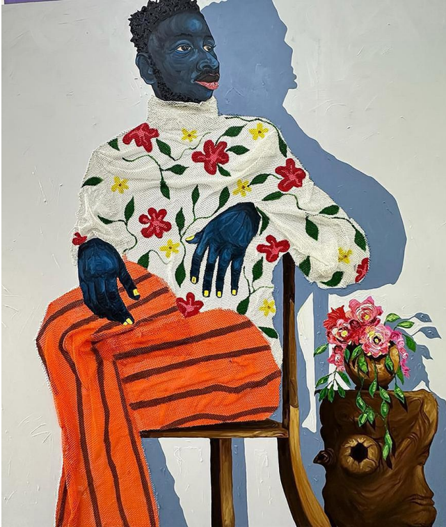
Gallery 1957 Adjei Tawiah, Untitled, 2023.