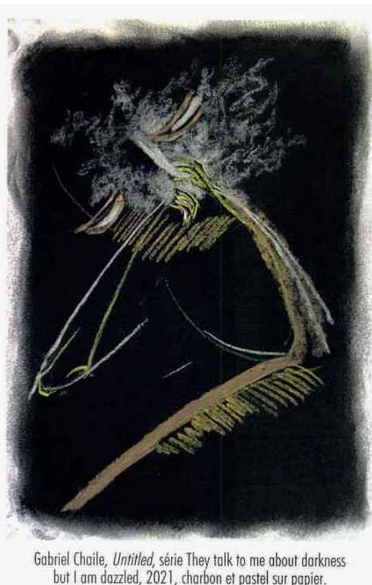
Gabriel Chaile, Untitled , série They talk to me about darkness but I am dazzled , 2021, charbon et pastel sur papier.

Desire Moheb Zandi, Screen Memories , 2020, acrylique, coton, corde, soie, tube, plastique, laine, cyberlo, laine vierge, peinture en spray, bois.