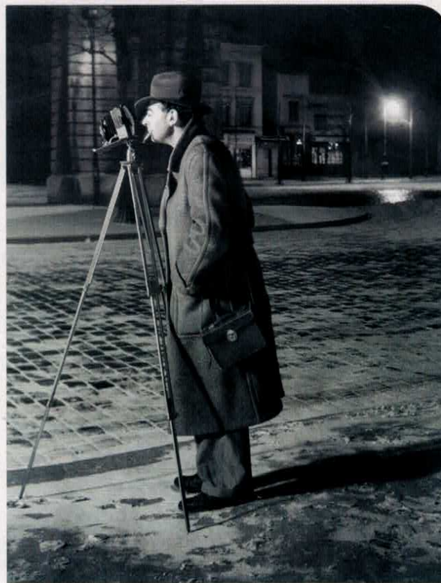
Brassai, Autoportrait boulevard Saint-Jacques , Paris, vers 1930, 29 x 22 cm. MUSEO PICASSO MÁLAGA, ESPAGNE

Bâle Kunstmuseum Basel St Alban-Graben 8 Continuously Contemporary: Nouvelles œuvres de la Fondation Emanuel Hoffmann 23 jan. > 9 jan. Camille Pissarro: L'atelier de la modernité 4 sept. > 23 jan.