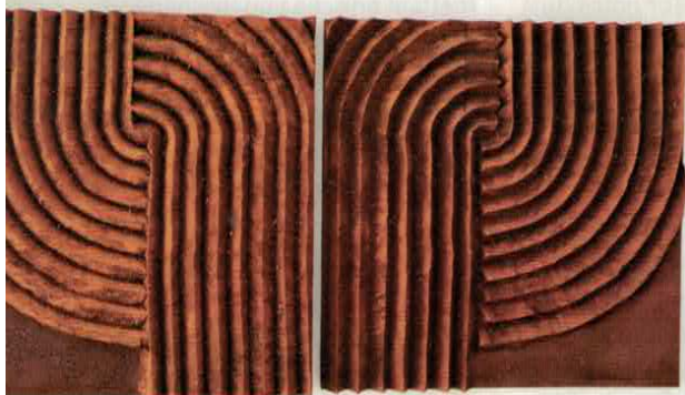
Fatiha Zemmouri, Landscape VIII , 2021, technique mixte.

► « The Sowers – Les Semeurs », Fondation Thalie, rue Buchholtz 15, Bruxelles (Belgique), www.fondationthalie.org