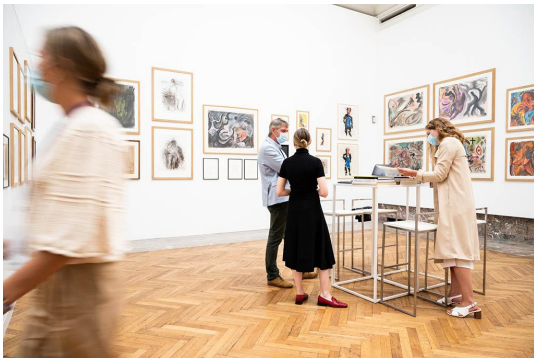
Art On Paper 2021