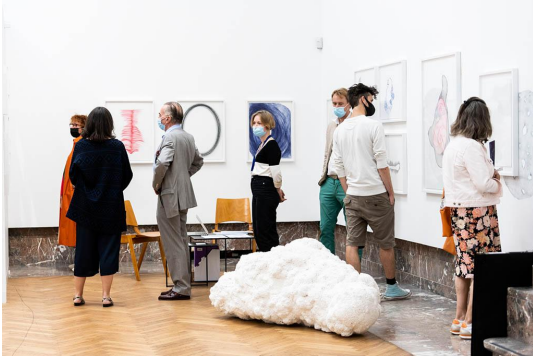
Art On Paper 2021