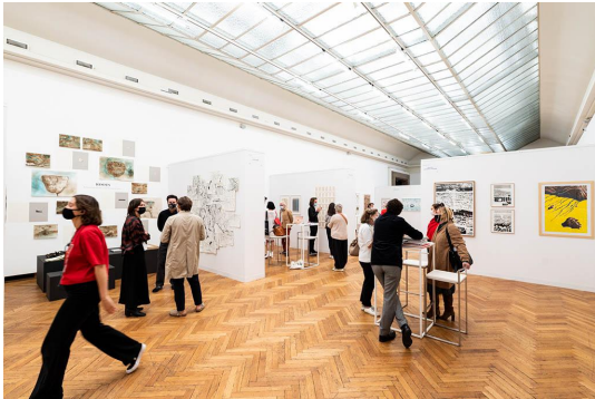
Art On Paper 2021